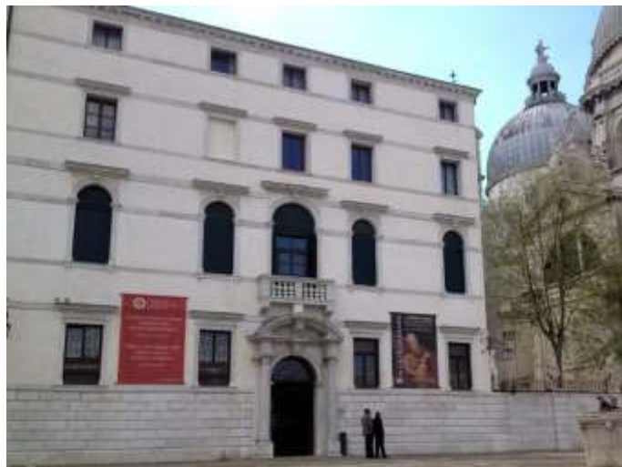
Il Seminario Patriarcale di Venezia in cui si trova la Cappella della Trinità