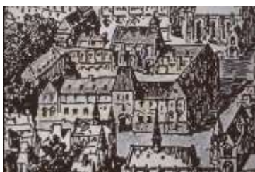
Parigi, Collegio Santa Barbara

In Spagna si riposa da un grave deperimento, risolve delle questioni pendenti a carico dei compagni; e nell'autunno - secondo il convenuto con essi - si dirige via mare [ Barcellona-Genova , ndr] a Bologna per finirvi gli studi di teologia. Ma, poco aiutato dal clima della città, si avvia a Venezia , dove arriva verso la fine del 1535 o l'inizio del 1536. Lì era d'accordo di attendere i compagni di Parigi perché tutti potessero agli inizi del 1537 salpare per la Terrasanta.