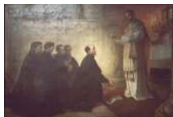
Parigi, il voto del 15 agosto 1534