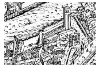
Venezia, Porta Santa Croce, attraversata da Ignazio al suo arrivo da Bologna