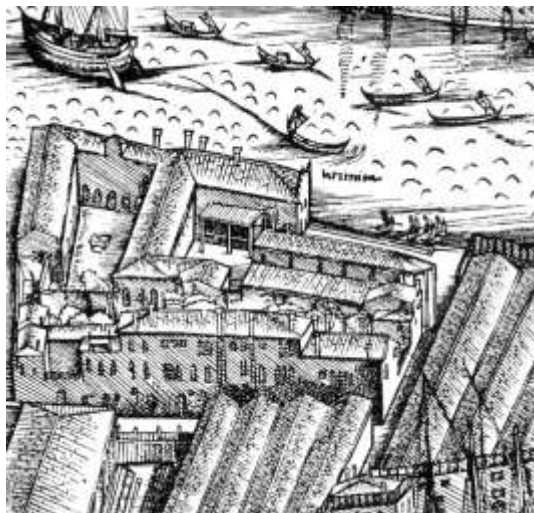
La chiesa ed il monastero della Trinità nella mappa di Venezia di Jacopo de' Barbari (1500)