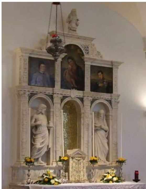
Altare della Cappella della Trinità